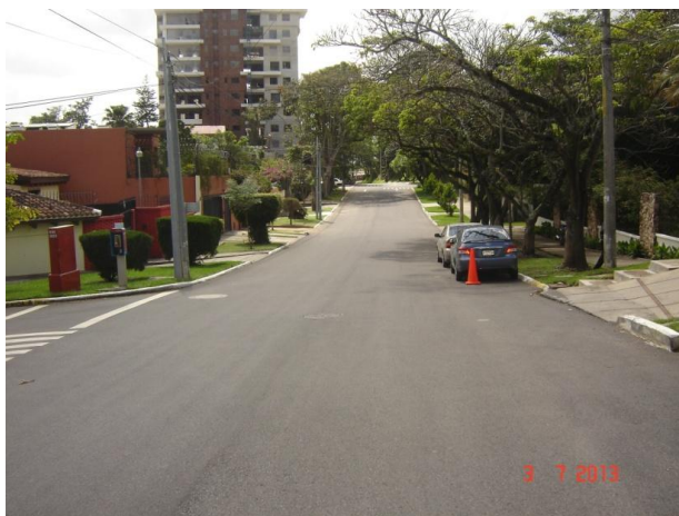
Figura 5: Tramo de carpeta de asfalto con agregado virgen 2009