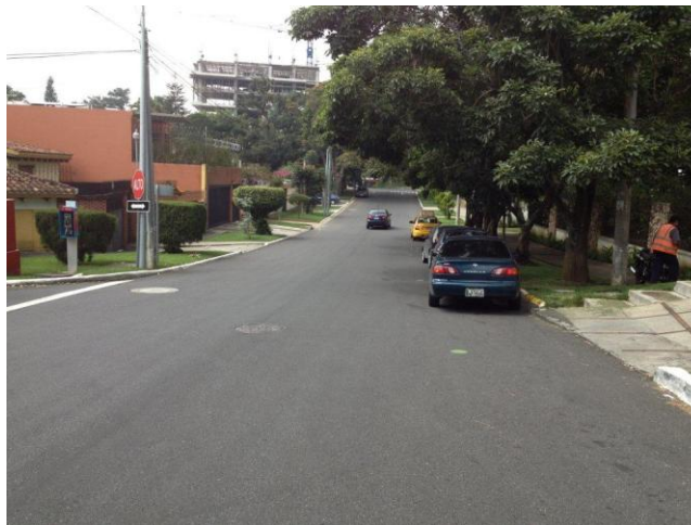
Figura 3: Ambas vías con RAP. La Herradura Zona 15 Municipalidad de Guatemala, 2010