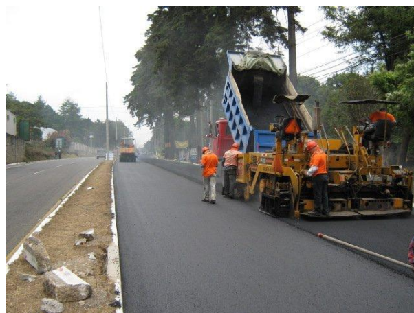
Figura 6: Tramo de carpeta de asfalto con agregado virgen 20013